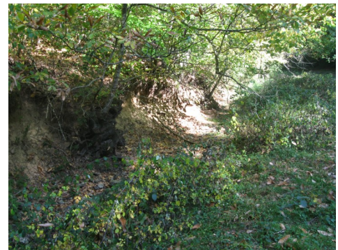
Cours d'eau soumis au piétinement