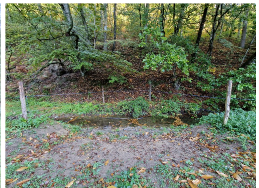
Descente aménagée sur cours d'eau